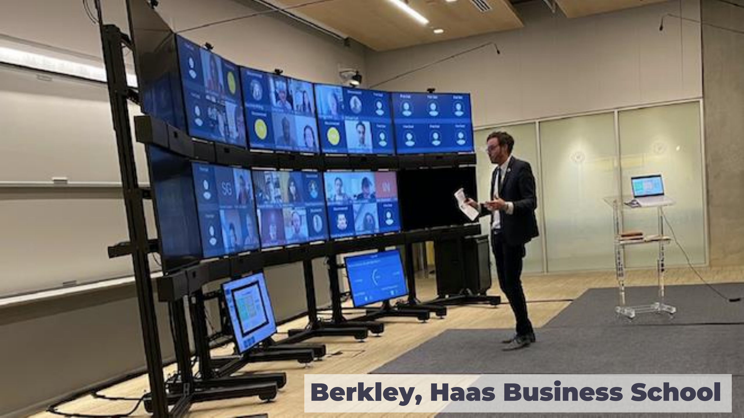
Berkley, Haas Business School